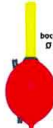
Ringhio Art. 554

deriva fibra - da gr. 1 a 10 filo passante laterale + rivetto ottone