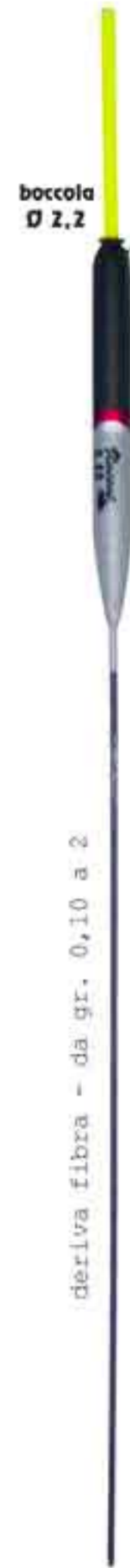
Lion Art. 678