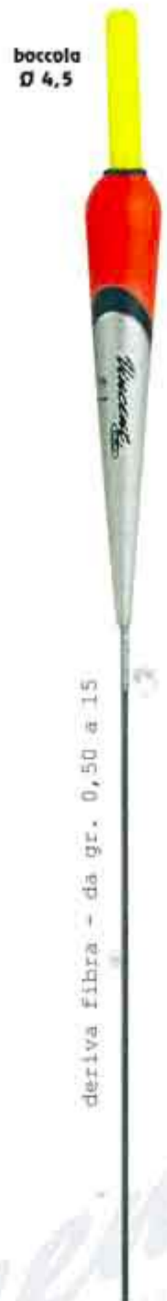
Conolux 4,5 Art. 054