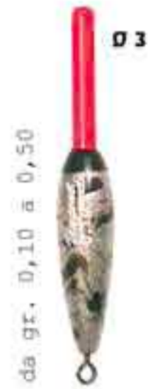
Billy Art. 512