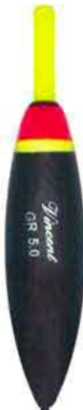
Obelix s.l. 4,5 Art. 858

deriva carbonio - da gr. 0,75 a 6. filo passante laterale + anellino