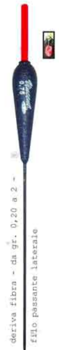
Lory Art. 738