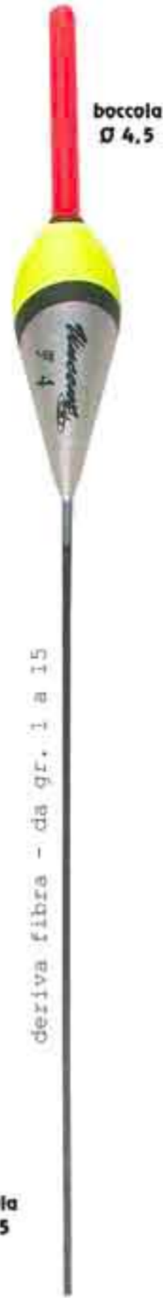
Cono vetro 4,5 Art. 445