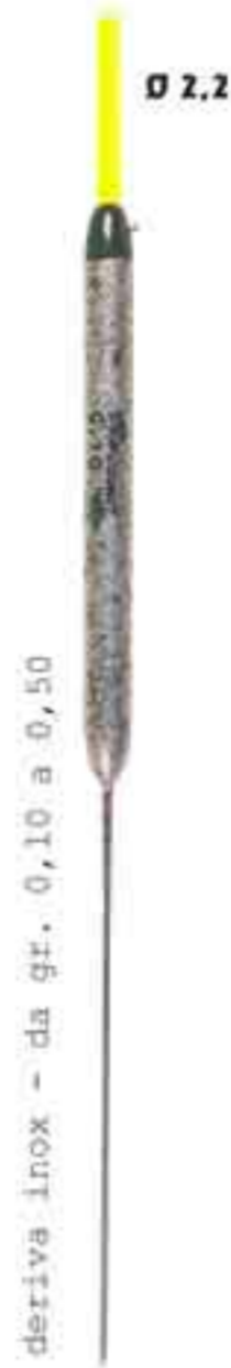
Rock Art. 466