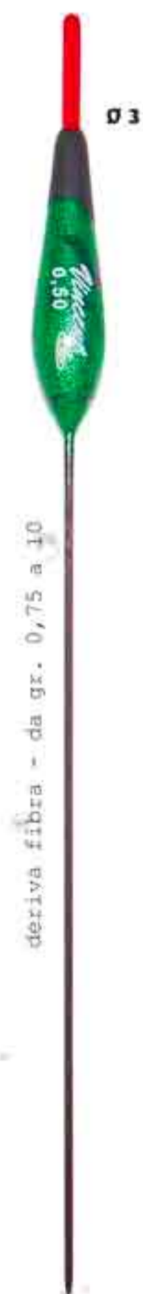
Desy Ø 3 Art. 135