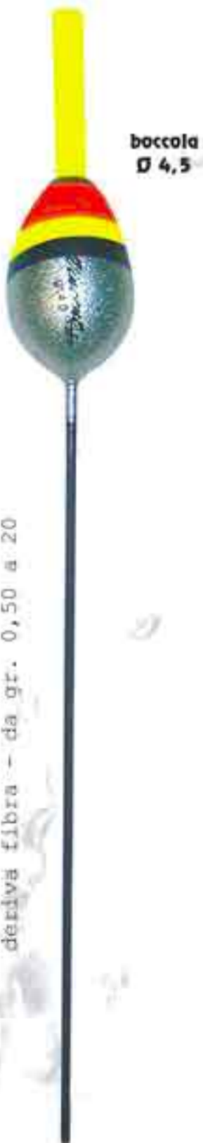
Onda Art. 097