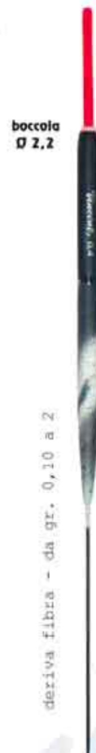
Igea Art. 793