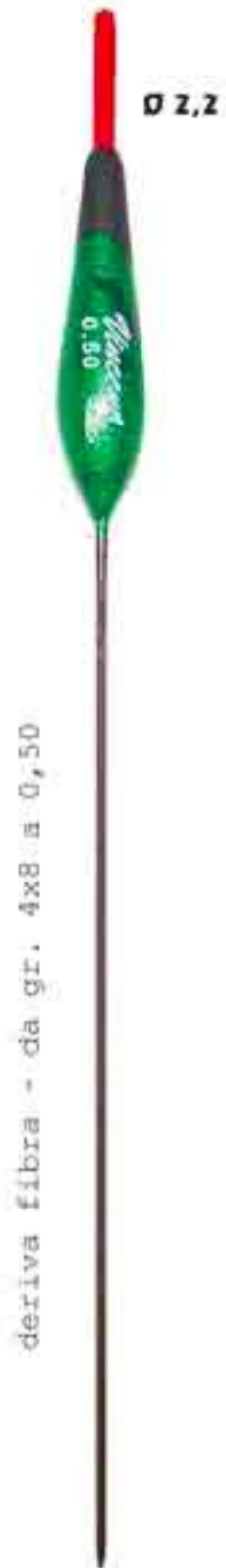
Desy Ø 2,2 Art. 135c