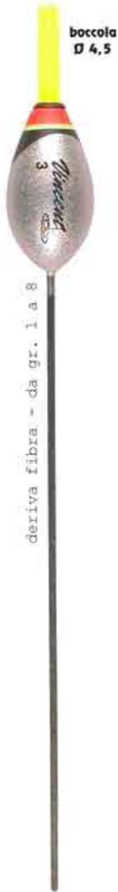
Pippo 4,5 Art. 446