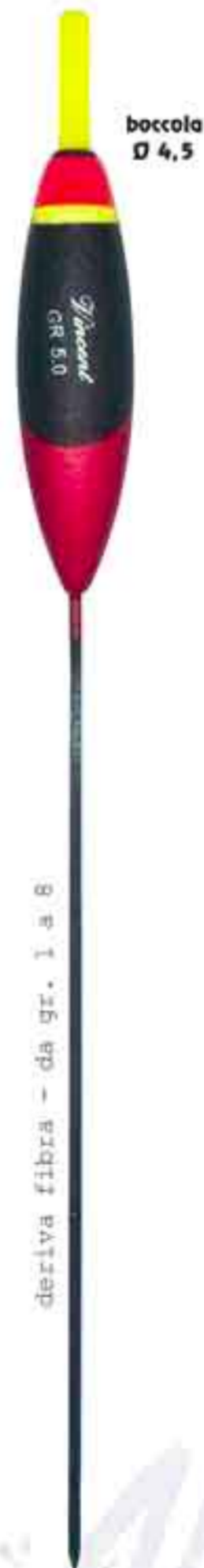
Foce 4,5 Art. 726