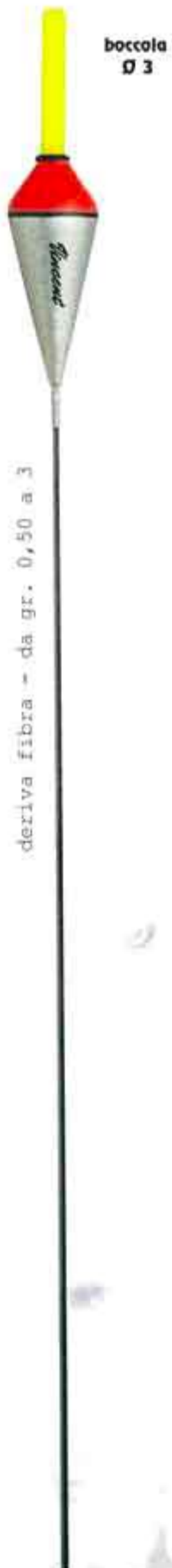
Pako Art. 065