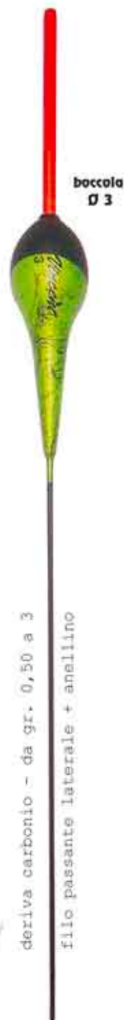
Tigre Art. 602

deriva carbonio - da gr. 0,50 a 3 filo passante laterale + anellino