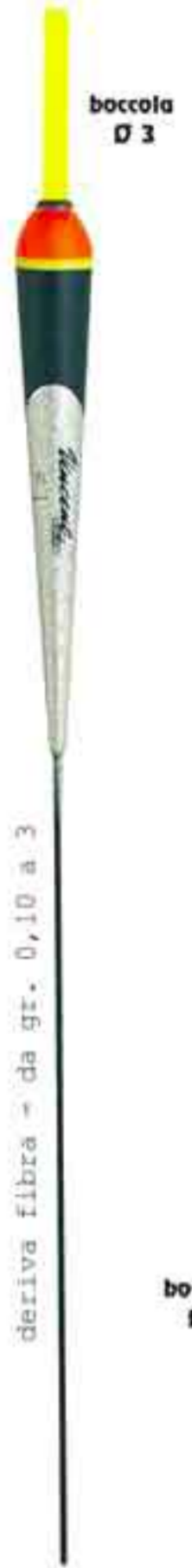
Conolux Ø 3 Art. 059