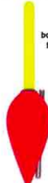
Enor Art. 562

deriva fibra - da gr. 1 a 8 filo passante laterale + anellino