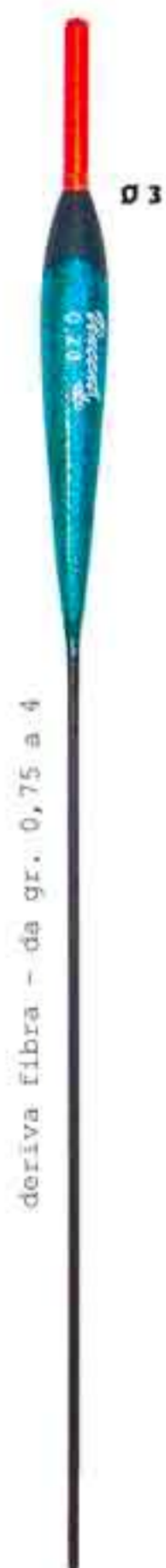
Blu Ø 3 Art. 093