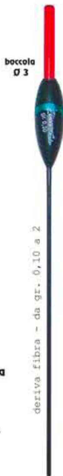
Felix Art. 613