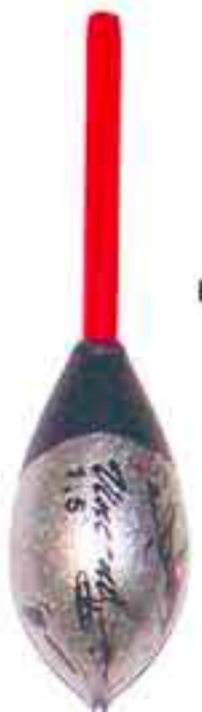
Asterix Art. 857

deriva fibra - da gr. 1 a 6 filo passante laterale + rivetto ottone