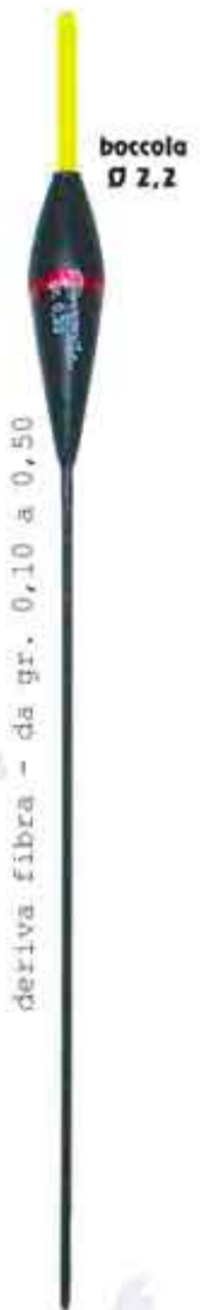
Teo Ø 2,2 Art. 550