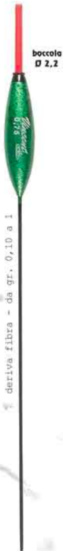
Doppia punta Ø 2,2 Art. 058b