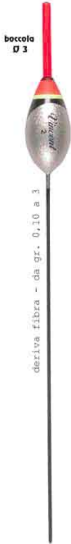
Pippo Ø 3 Art. 067