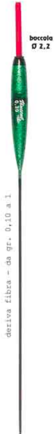
Cristal Ø 2,2 Art. 205