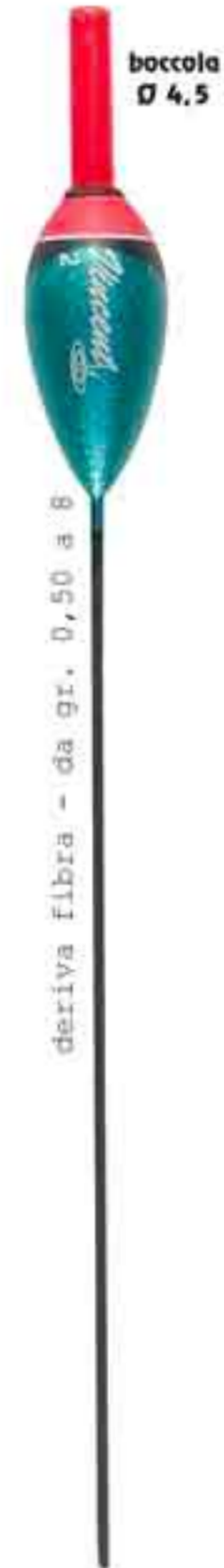
Classic 4,5 Art. 476