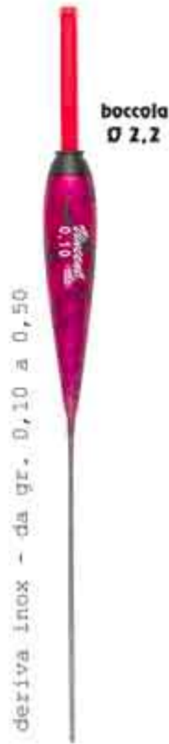
Gatto inox Art. 467