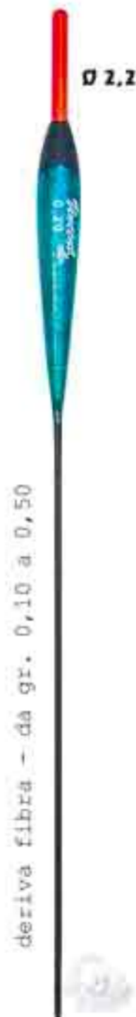
Bla Ø 2,2 Art. 093b