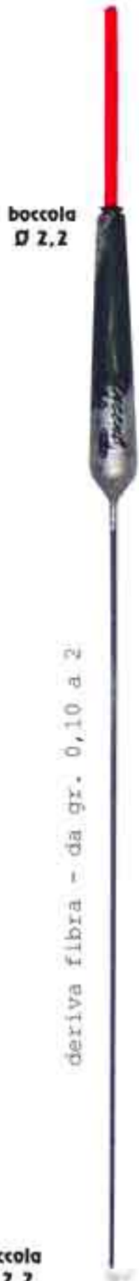
Fly Art. 669