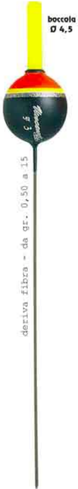
Riccio Art. 160