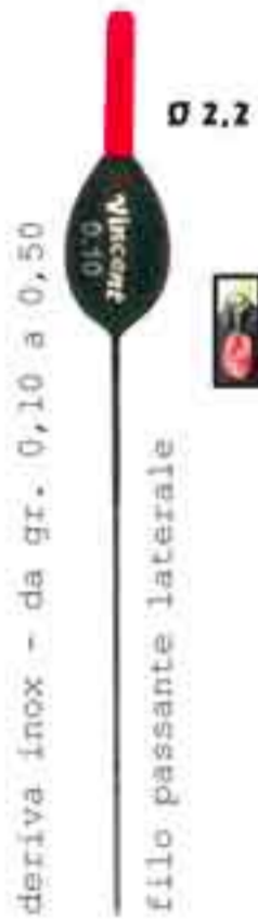
Stisa pera inox s.l. Art. 166