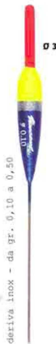
Halk Art. 208