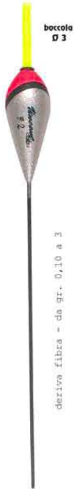
Cono vetro Ø 3 Art. 057