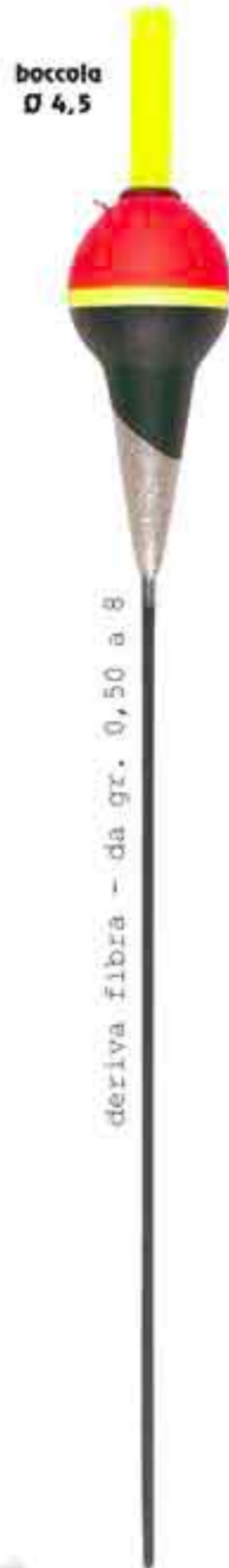
Mitico Art. 159