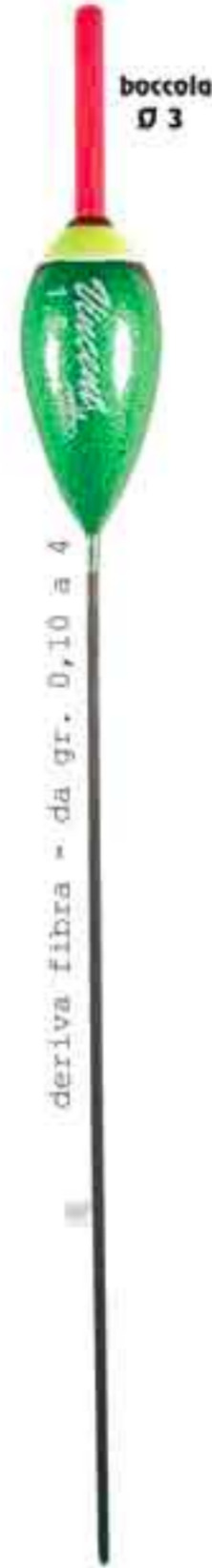
Classic Ø 3 Art. 203