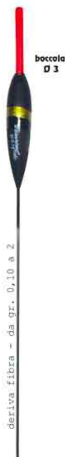
Boxer Art. 553