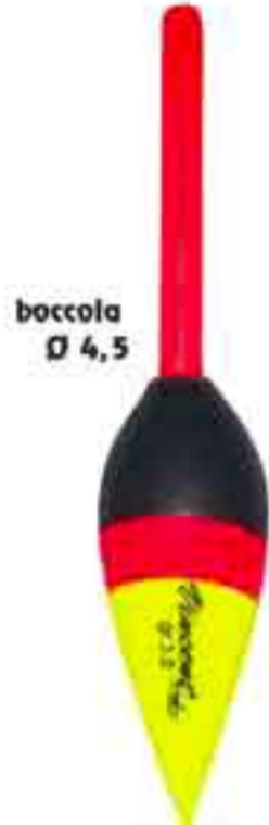
Sole s.l. 4,5 Art. 728

deriva fibra - da gr. 1 a 6 filo passante centrale