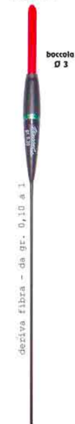
Cristal Ø 3 Art. 552