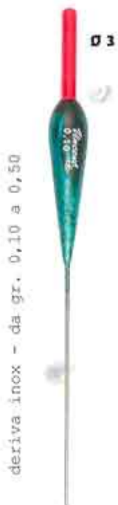
Cono inox new Art. 468