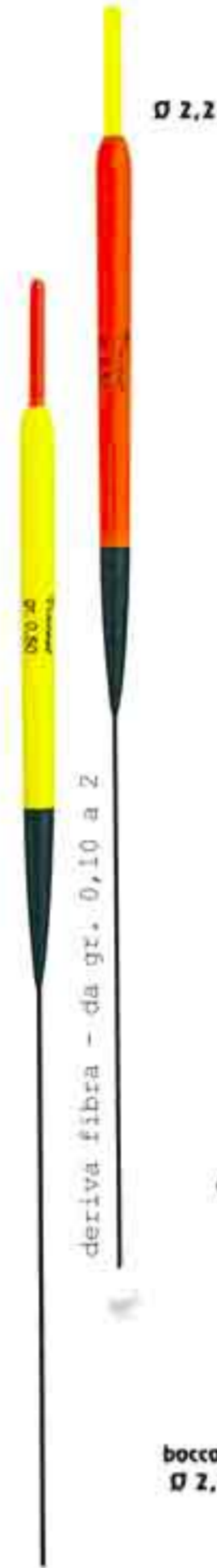
Spillo Art. 078