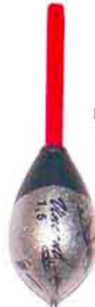
Stisa pera s.l. Art. 813

deriva fibra - da gr. 0,50 a 10 filo passante laterale + anellino