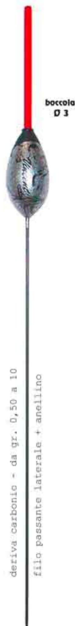
Cobra Art. 603

deriva carbonio - da gr. 0,50 a 10 filo passante laterale + anellino