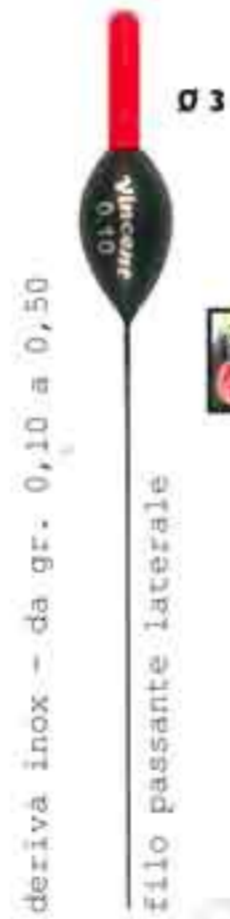
Stisa mela inox s.l. Art. 166b