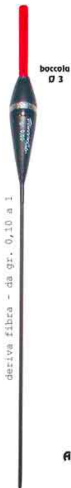
Teo Ø 3 Art. 551