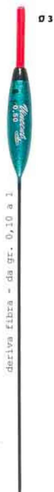
Doppia punta Ø 3 Art. 058