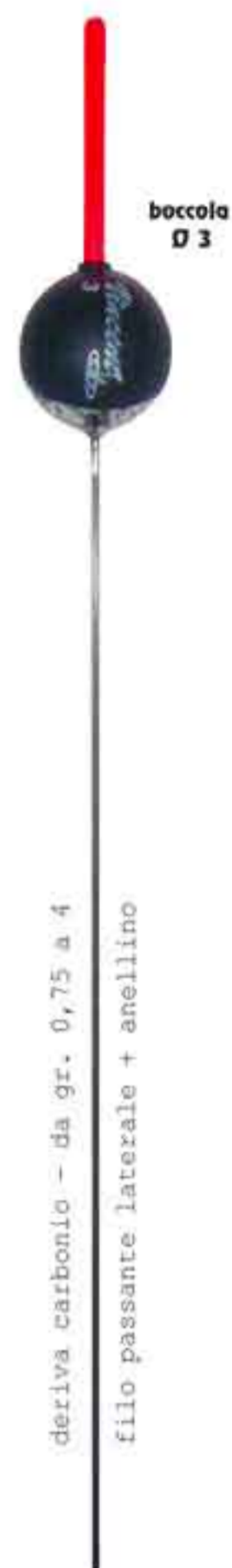
Giglio Art. 769

deriva carbonio - da gr. 0,75 a 4 filo passante laterale + anellino