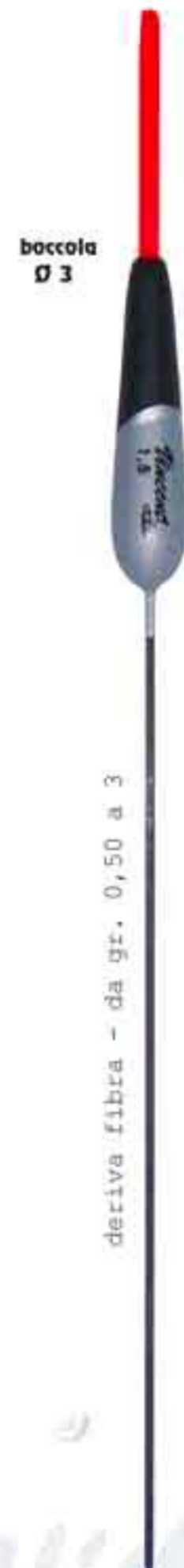
Elba Ø 3 Art. 661