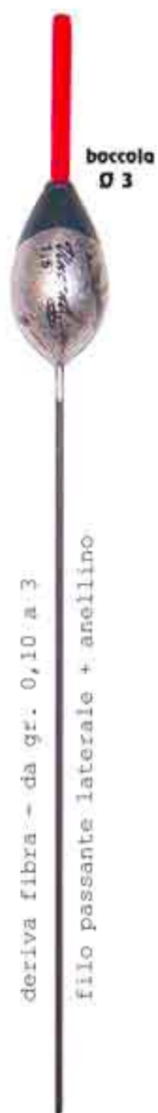
Stisa pera s.l. Art. 162

deriva fibra - da gr. 0,10 a 3 filo passante laterale + anellino