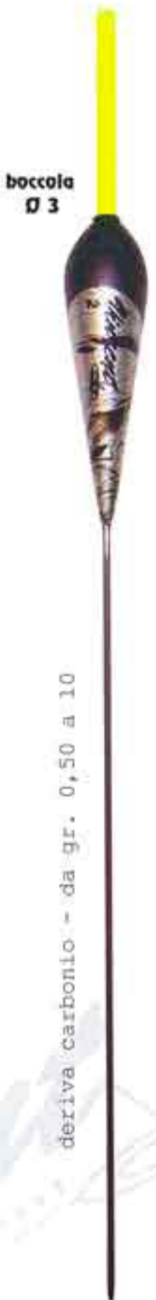
Billo Art. 604