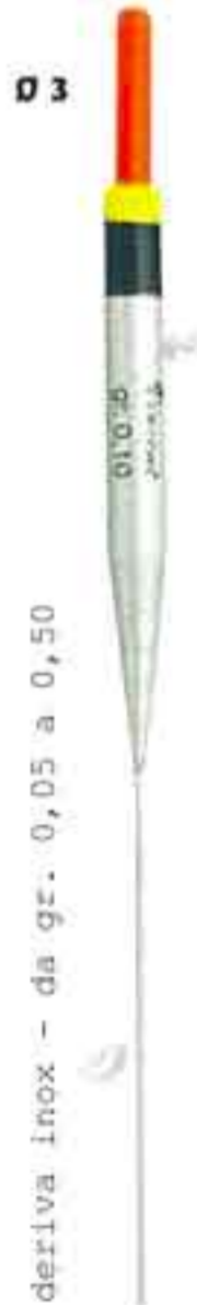
Galla inox s.l. Art. 098