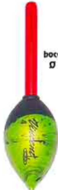
Stisa mela s.l. 4,5 Art. 161b

deriva fibra - da gr. 0,50 a 10 filo passante laterale + anellino