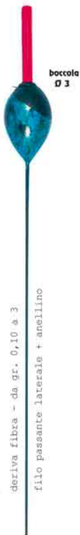
Stisa mela s.l. 3 Art. 161

deriva fibra - da gr. 0,10 a 3 filo passante laterale + anellino