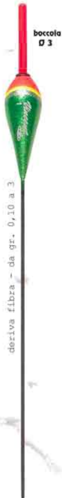
Silver Ø 3 Art. 405