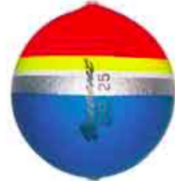
Sfera siluro Art. 110