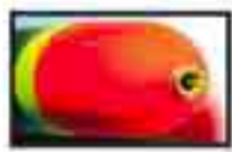
Tiston scorr. Art. 541