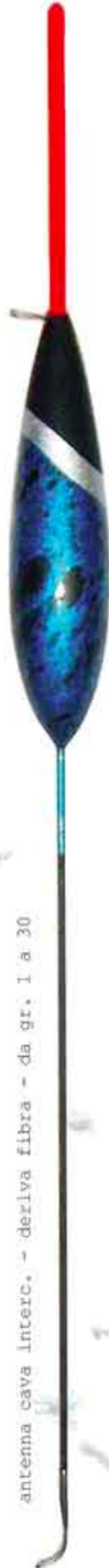
Breme Art. 659