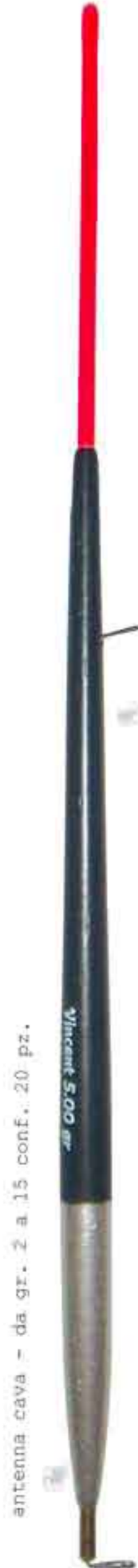
Garda Art. 229