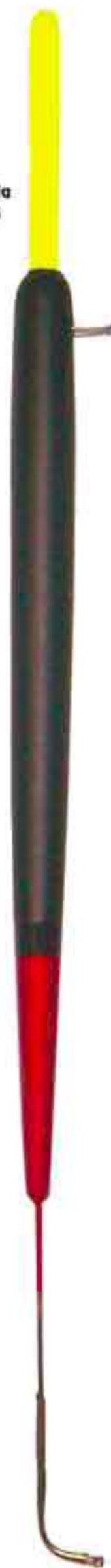
Garda S.L. Art. 099

deriva fibra - da gr. 0,50 a 20 conf. 20 pz. 25 a 30 conf. 10 pz.