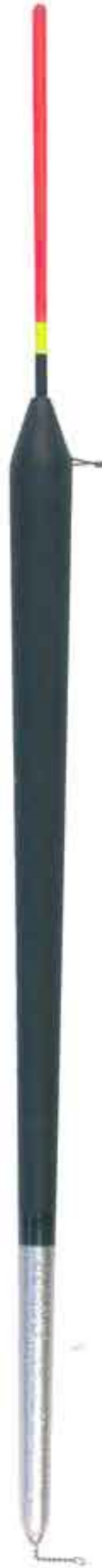
Garda rovesciato Art. 429