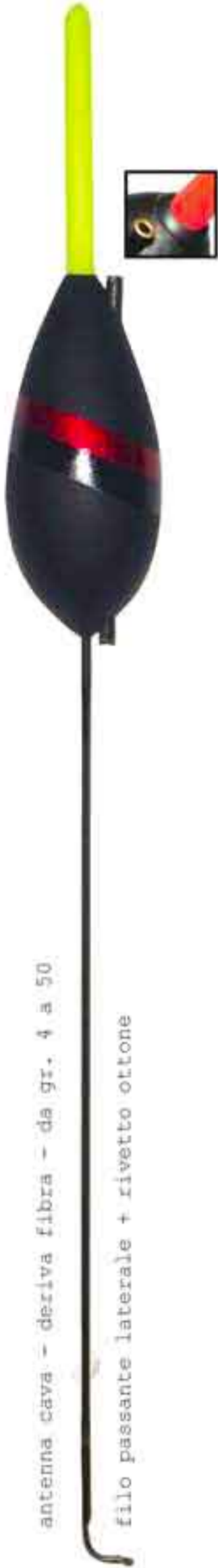
Clarius Art. 762