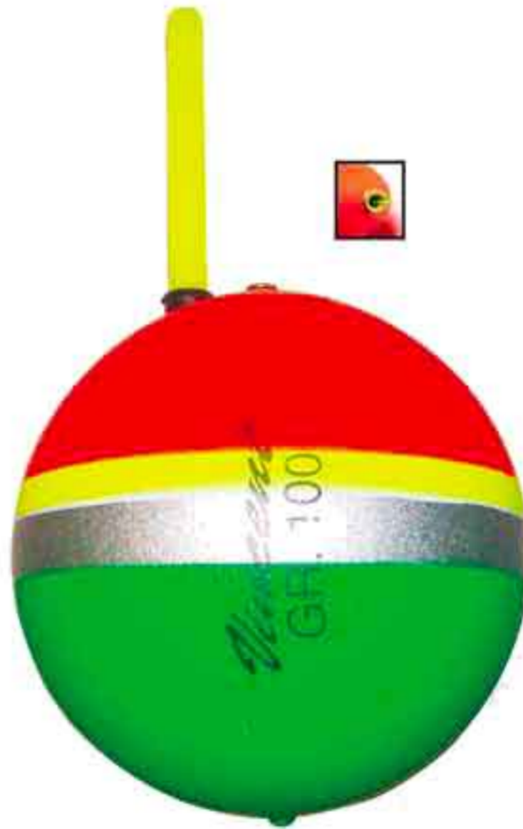
Sfera siluro s.l. Art. 538