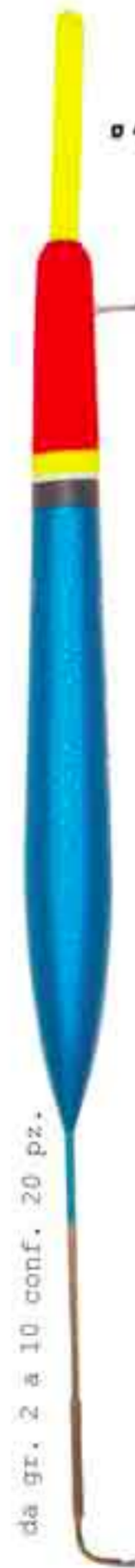
Zagor Art. 132