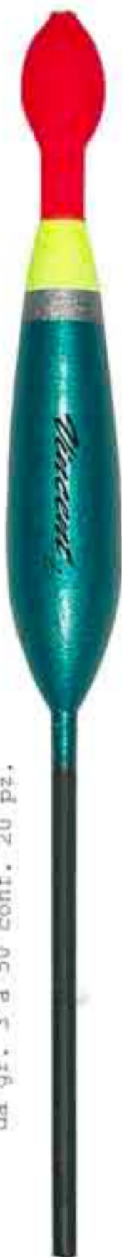
New Tiston scorr. Art. 542