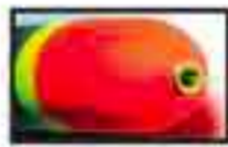
Pisa Art. 113