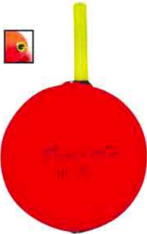
Sfera siluro strong Art. 620