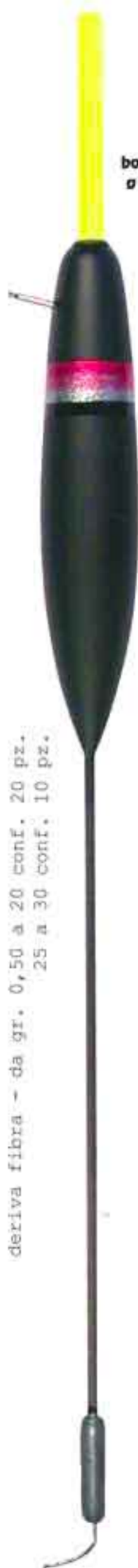
Sirio scorr. Art. 210