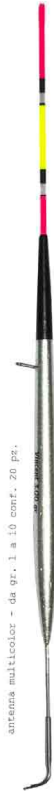
Garda multicolor Art. 053