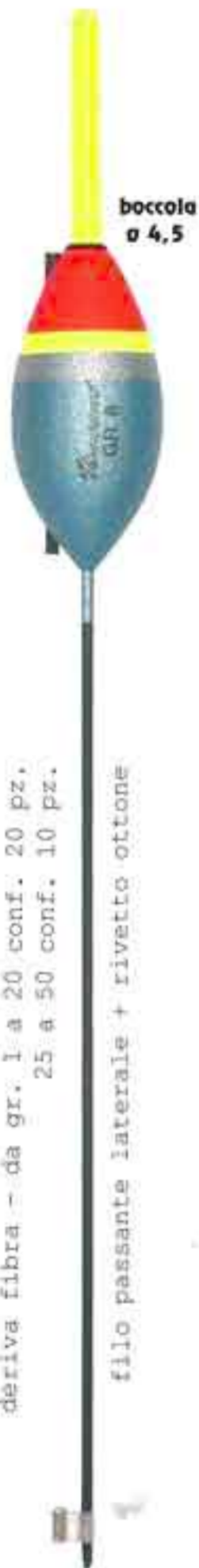
Metal Art. 064