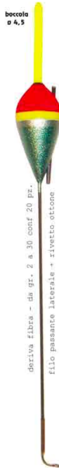
Marte Art. 556