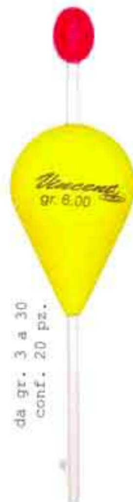
Pera new Art. 069b