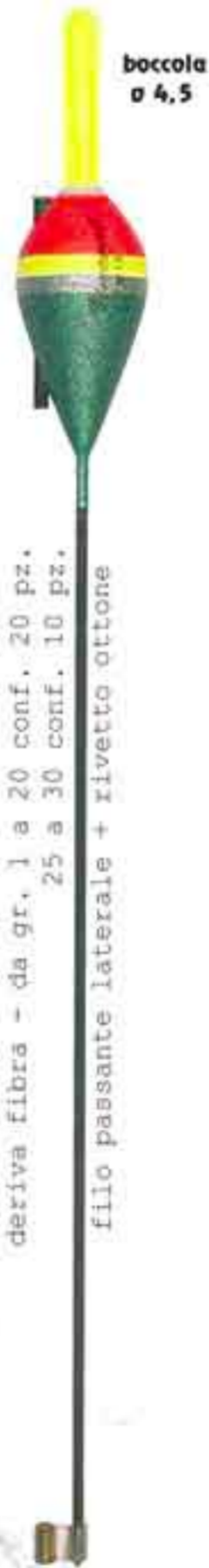
New Art. 055