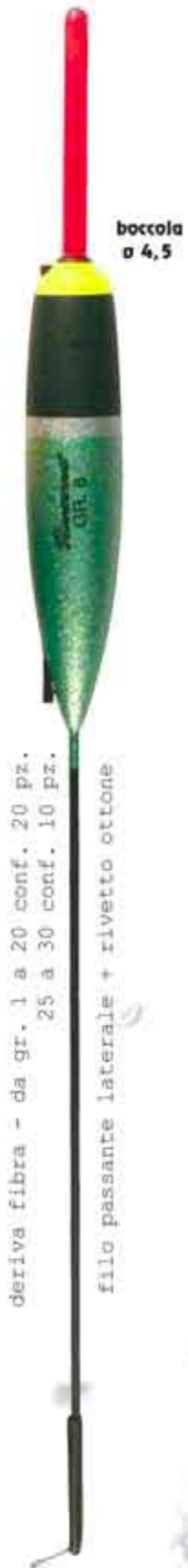
Bingo Art. 412