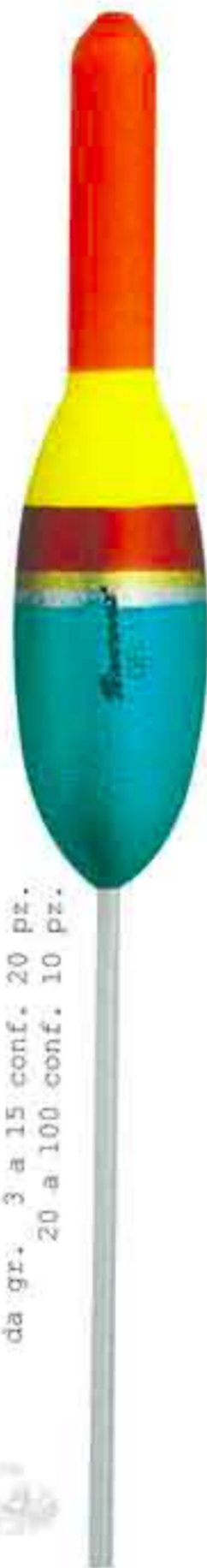
Mare Art. 112

da gr. 3 a 15 conf. 20 pz. 20 a 100 conf. 10 pz.