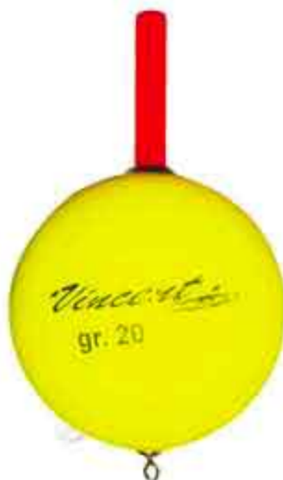
Sfera Siluro inglese Art. 590

da gr. 10 a 100 conf. 20 pz. completamente starata