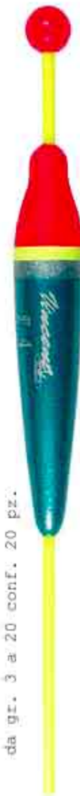
Stecco scorr. Art. 431

da gr. 3 a 15 conf. 20 pz. 20 a 100 conf. 10 pz.