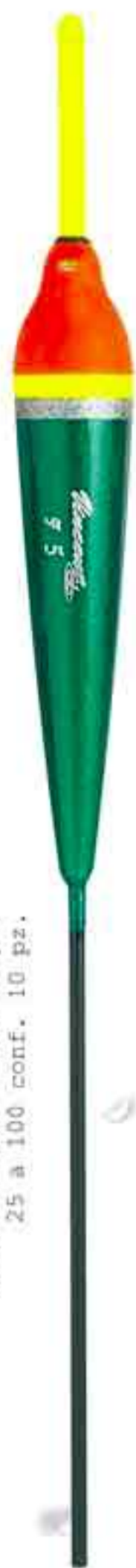
Zeus Art. 148

da gr. 3 a 20 conf. 20 pz. 25 a 100 conf. 10 pz.