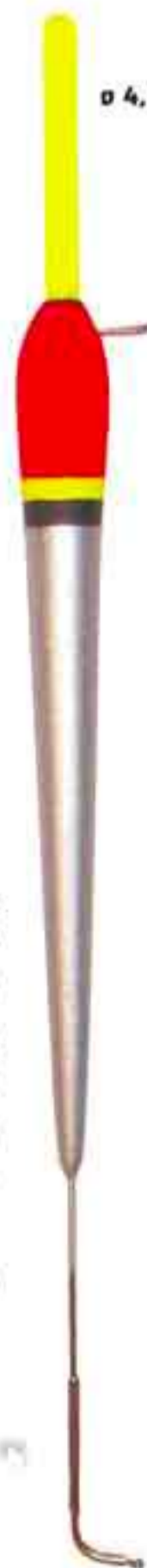
Tex Art. 133